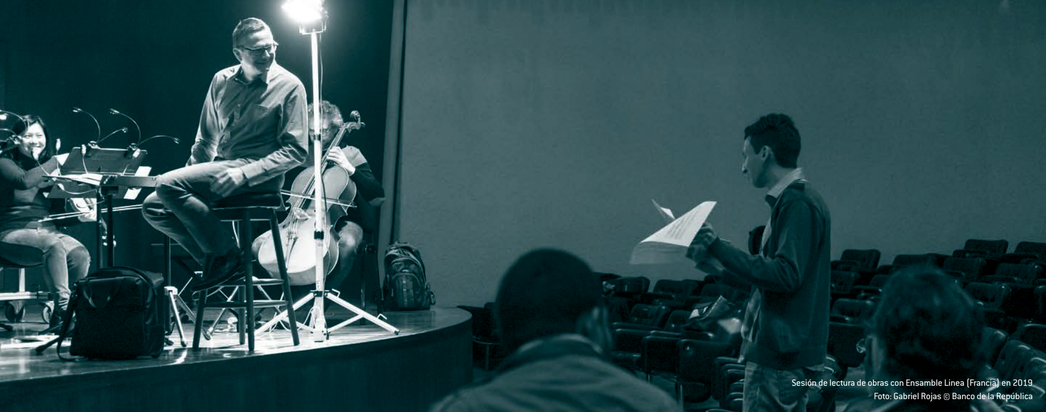
Sesión de lectura de obras con Ensamble Línea (Francia) en 2019